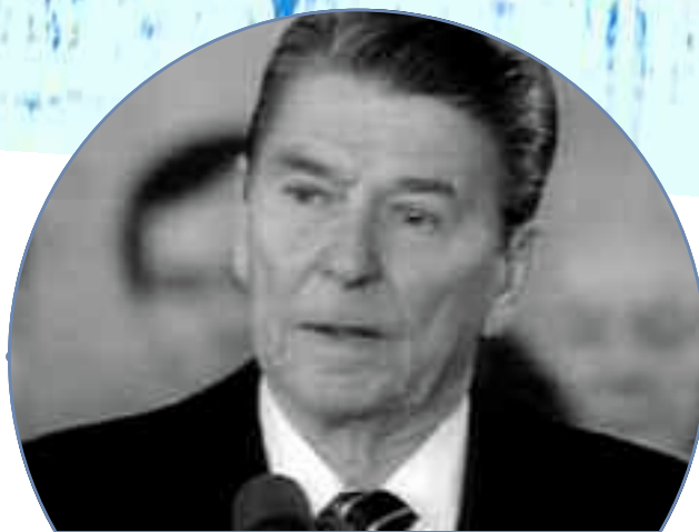
Ronald Reagan και George H. W. Bush. Οι 2 πρόεδροι των ΗΠΑ δεν έμειναν στα λόγια αλλά συνέβαλαν τα μάλα στην εξάπλωση της «κοινωνίας των πολιτών».

ωνική εργασία όσων συμμετείχαν στην «civil society» και το οποίο οι θεωρητικοί στην Γαλλία ονόμαζαν «κοινωνική οικονομία», ενώ στην αντίπερα όχθη του Ατλαντικού, πάντα πιο «πραγματιστές», το ονόμασαν «τρίτος τομέας», συνδέοντάς το εμμέσως με τον ήδη χρωματισμένο ως αταξικό τομέα των υπηρεσιών.