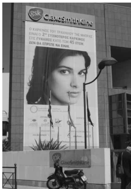
Το πανό καλύπτει την πρόσοψη των γραφείων της GlaxoSmithKline στη Λεωφόρο Κηφισίας στην Αθήνα. Προετοιμασία για την είσοδο του «τραχηλίξ» στην ελληνική αγορά.

Ο καρκίνος ανήκει στην ομάδα των ασθενειών που πήραν στον 20ο αιώνα τη σκυτάλη από παλιότερες μαστιγες ή επιδημίες. Η ιδέα ότι τέτοιου τύπου ασθένειες, που εμφανίζονται κατά καιρούς σε μεγάλες ομάδες πληθυσμών προκαλούνται από την επίθεση ιών, είναι μια ιδέα ελκυστική για όσους κατασκευάζουν και πουλάνε θεραπεία ή πρόληψη. Ο ιός εντοπίζεται, μελετάται, και με τον καιρό βρίσκεται κάποιος κύριος Frazer να προετοιμάσει την