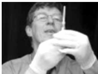
Ο Ian Frazer σε χαρακτηρισική πόζα, έτοιμος να σώσει τις γυναίκες από τον killer ιό.

Μέχρι τα τέλη της δεκαετίας του '90 ο Frazer είχε τελειώσει τη δουλειά του, την οποία έσπευσε να αγοράσει η Merck, κολοσσιαίων διαστάσεων φαρμακευτική εταιρεία αμερικανικών συμφερόντων. Ακολούθησαν τέσσερα χρόνια δοκιμών του εμβολίου, που στις περισ-